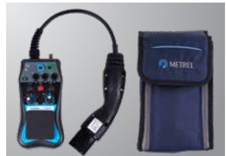
Photo d'un kit 1532 XA

Note! Les photographies de ce catalogue peuvent différer légèrement des instruments au moment de la livraison. Sous réserve de modifications techniques sans préavis.